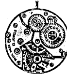
Cal. 50 (7 3/4 mm)