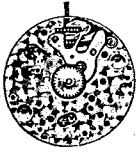
Cal. 50 et 60 (7 3/4 mm)

Calibres ancre — Anker Werke — Calibros ancora — Lever movements